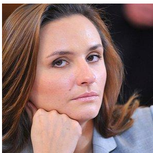
Брусникина Ольга Александровна

Помощник Министра здравоохранения Российской Федерации